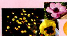
三田市・ガーデニングのはなし