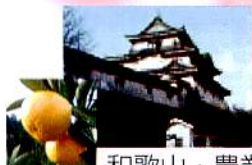
和歌山・農業と流通のはなし

世界文化遺産の東大寺で 池の浄化・松の蘇生に 大活躍のEM(有用微生物群) 小さな体で大きな働き