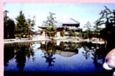
東大寺・松の蘇生と池の浄化のはなし