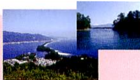
天の橋立・阿蘇海の浄化のはなし