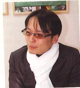
映画監督 白鳥 哲氏

「愛」や「感動」などのポジティブな心の働きが眠っている遺伝子をオンに変え、「祈り」が遺伝子に影響を与える事を研究している分子生物学者の村上和雄博士の他、ホリスティック医学の権威ディーバック・チョブラ博士、細胞生物学者ブルース・リプトン教授などが登場し、「祈り」を含めた意識研究の最先端を明らかにしていく。(2012年公開)