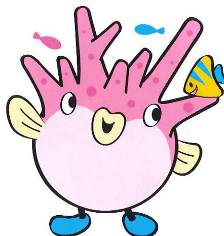
大会キャラクター アバサンゴ

主な行事／「式典行事」11月18日(日) 糸満市西崎総合体育館 「海上歓迎・放流行事」11月18日(日) 糸満漁港北地区 「関連行事」11月17日(土)、18日(日) 道の駅いとまん周辺